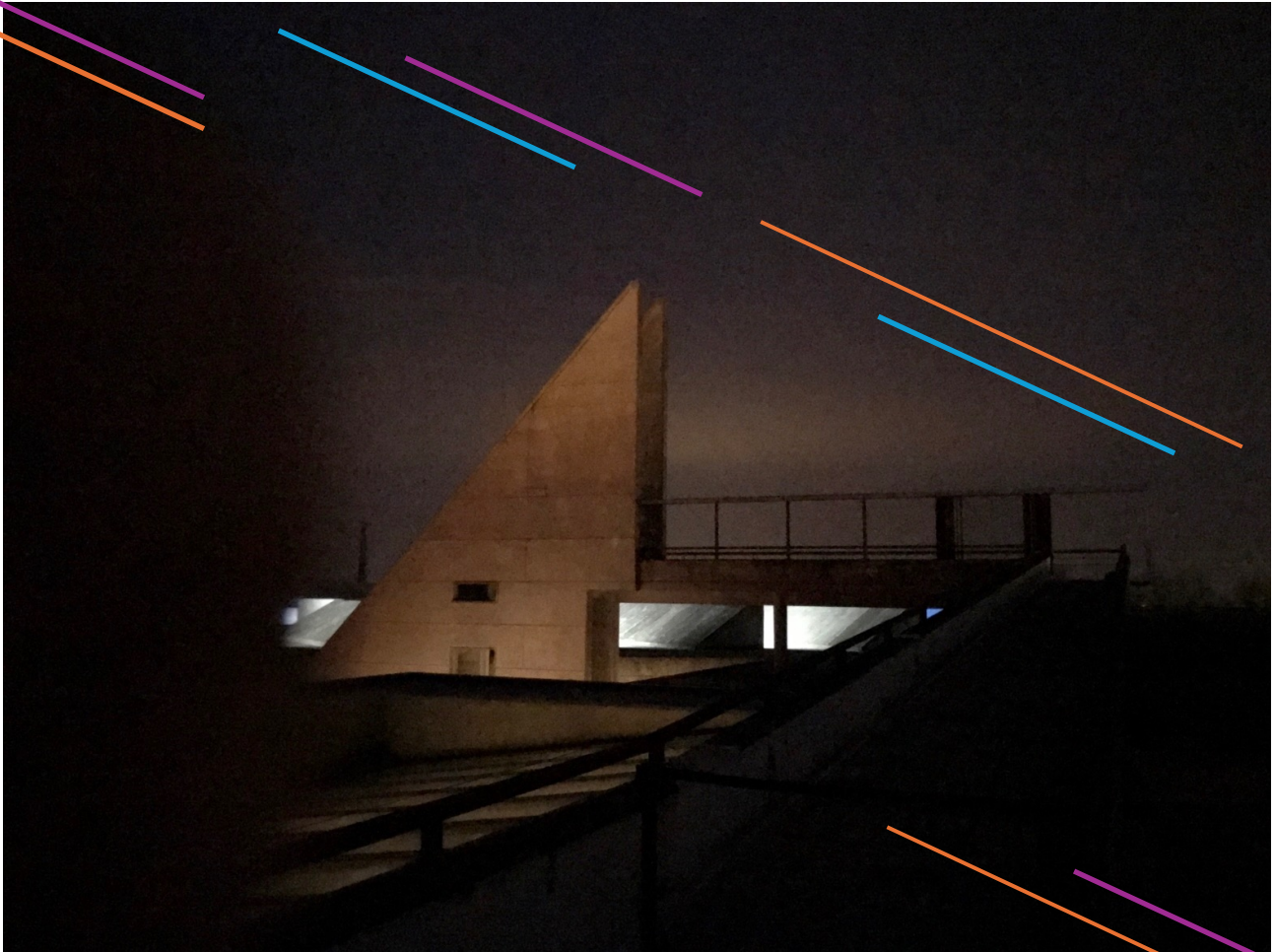
© Didier Flamand (Musée Arles Antique)

Pensée comme un temps fondateur, cette lecture publique permettra de partager l'élan et l'originalité de cette œuvre, d'en éprouver la portée auprès d'un public et de futurs partenaires, pour engager les conditions nécessaires au développement du projet cinématographique.